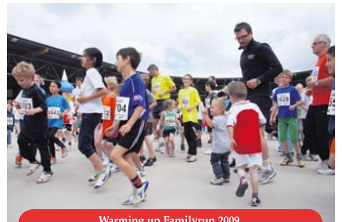
Warming up Familyrun 2009

Wat bezielt een gerenommeerde verslavingsinstelling als SolutionS om hoofdsponsor te worden van een hardloopevenement? Deze vraag kwam een aantal keren voorbij tijdens de derde Letterenloop, waar meer dan tweeduizend kinderen en volwassenen de hardloopschoenen aantrokken voor afstanden tussen één en tien kilometer. Het evenement werd zoals altijd gehouden op de eerste zondag van de maand juni, de start- en finishlocatie was de Haarlemse ijsbaan.